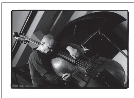
Peter Kowald, Bass, AdK Berlin, 1995

Detlev Schilke , geboren 1956 in Ost-Berlin, begann 1979 als Autodidakt zu fotografieren. Bereits 1983 gewann er bei einem Fotowettbewerb den Preis »Fotos des Jahres« mit einer Serie des Pianisten Horace Parlan. Es folgten ab 1985 erste Veröffentlichungen im »Jazz Forum - The European Jazz Magazine«, Warschau.