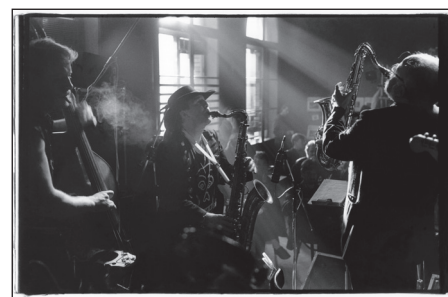
NRG Ensemble, Franz-Club, Berlin, 1991